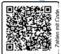
Zahlen mit Code

... sind in die Jahre gekommen. Der eine klemmt, bei einem anderen Balken fehlt bereits ein Scharnier, der nächste lässt sich nicht mehr schließen. So ist eine Renovierung notwendig geworden. Zuerst hat in mehreren Tagen Arbeit ein Tischler Scharniere und Holzteile wieder instand gesetzt. Nun müssen die Balken noch von einem Maler gestrichen werden, damit das Wasser nicht in das frisch bearbeitete Holz eindringt. - Mit Ihrer SPENDE helfen Sie diesmal den Bestand des Pfarrhauses zu erhalten. Die voraussichtlichen Gesamtkosten belaufen sich auf etwa € 11.500,00. Vielen Dank bereits im Voraus! Bitte nutzen Sie für Ihre Spende den praktischen QR-Code. Sollten Sie einen Erlagschein benötigen, wenden Sie sich bitte an das Pfarrbüro.